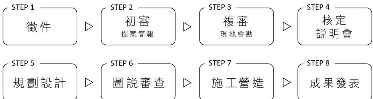
圖 1 計畫執行流程圖

以影像記錄執行過程，並透過記者會或其他形式，公開發表本案成果，介紹合作學校之原住民族文化學習場域營造成效，作為計畫示範學校。