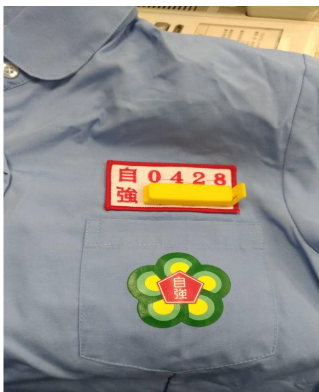
制服名牌縫於口袋上方