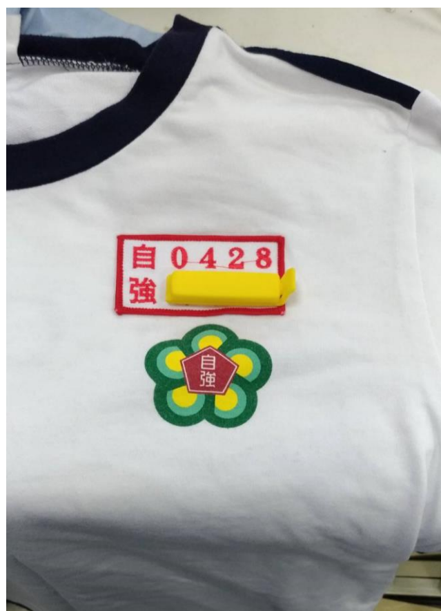
體育服名牌縫於校徽上方