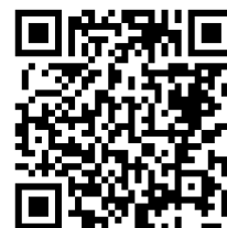
桃園市公立及非營利幼兒園 招生網