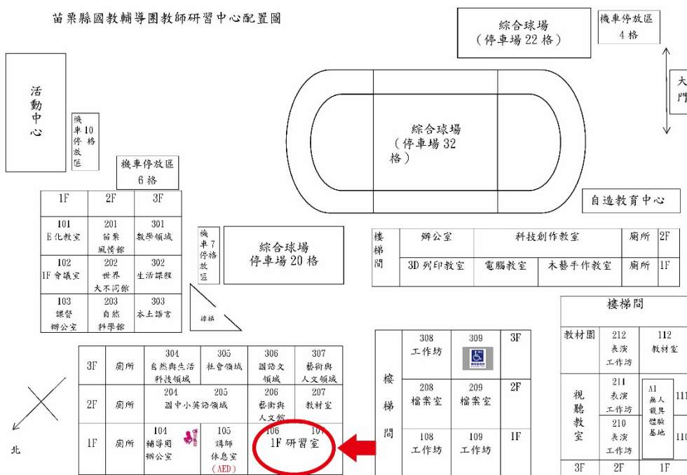
苗栗縣國教輔導團教師研習中心配置圖