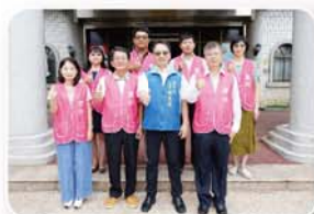
新北市蘆洲區公所—以人為本，創造共榮、 宜居(友善環境、健康、高齡友善、文化、安全)的新、心蘆洲

打造「亞洲新灣區」，帶動城市轉變；透過國際競圖徵選，結合綠色建築概念，並建構多項全球首創之建築工法，打造國際水準地標建築；另增加溝通協調及介面整合，全面管控施工品質，成為綠色公共建築新典範。