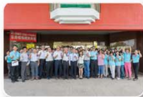
交通部公路總局第三區養護工程處— 「開路先鋒~典藏三工」

監造后豐大橋提前完工，彰顯施政效能；克服沙鹿陸橋眾多挑戰並撰文弭災之道，安民行且提升對政府信任；完善中橫便道通行市公車並長期守護；踏勘青山上線有益復建推動及永續；創新公路亮點成為新地標，為文化融合立典範。